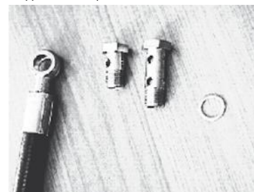
Фитинг „банжо“, болт, двойной болт, медное кольцо

Информацию, является выбранное изделие стандартным или нестандартным, можно найти в действующем прайс-листе. Указанные размеры могут быть изменены в любое время без предварительного уведомления.